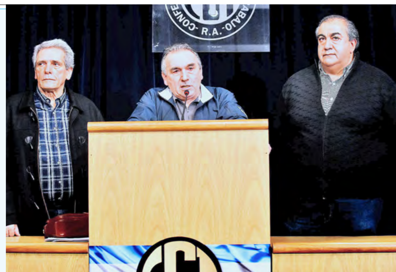
El triunvirato de la CGT avala la reforma laboral y deja pasar las medidas del gobierno