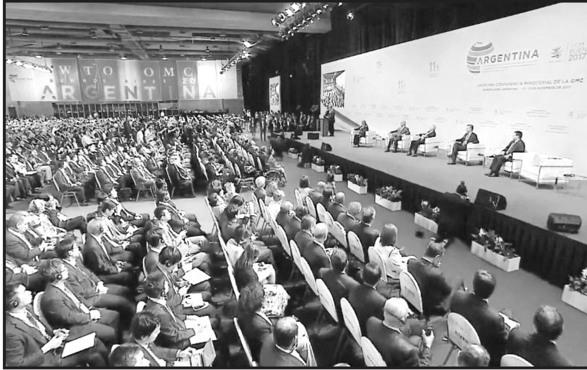
La reunión de la OMC, a favor de las multinacionales y en contra de los trabajadores y sectores populares

Existen tres grandes organismos internacionales a escala global: el Fondo Monetario Internacional, el Banco Mundial y la Organización Mundial de Comercio. Dirigidos por los países más poderosos, estas instituciones conforman el actual orden mundial del capitalismo imperialista. Este carácter explica que la OMC plantee una agenda que defiende los intereses de las grandes corporaciones transnacionales. Su política es que los países dependientes y semicoloniales, como la Argentina, amplíen la apertura de sus mercados industriales y comerciales y liberalicen sus legislaciones sobre la protección del medio ambiente y las inversiones extranjeras. Sintetizando: busca imponer términos de intercambio comercial y de "apertura a los capitales" a favor de las multinacionales, las grandes ganadoras, a costa de la clase trabajadora y los pueblos de esos países, los perdedores. Por ello nada bueno saldrá para