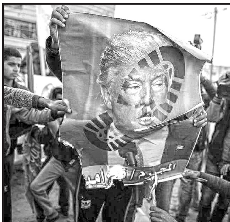
Movilizaciones contra la decisión de Trump

Unidad Internacional de los Trabajadores-Cuarta Internacional (UIT-CI) 7 de diciembre de 2017