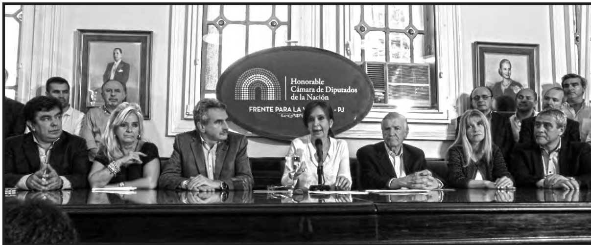
La decisión de Bonadio de detener a dirigentes kirchneristas y pedir el desafuero de Cristina fue utilizada para tapar el ajuste