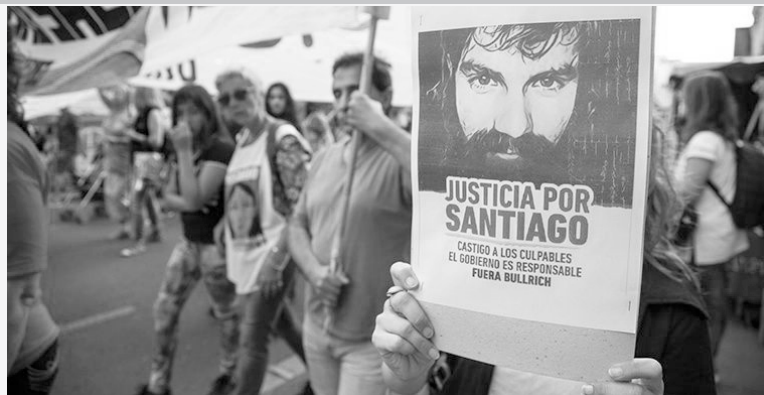
La Gendarmería y el gobierno son los responsables

Desde Izquierda Socialista vamos a seguir reclamando justicia por Santiago Maldonado, exigiendo que se conforme una comisión investigadora independiente que pueda llegar a la verdad y el castigo de los culpables. ¡A más de 4 meses de la muerte de Santiago no hay gendarmes ni funcionarios procesados! Denunciamos la responsabilidad de Bullrich-Noceti y del gobierno en la represión de la comunidad mapuche que terminó con la muerte de Santiago, así como su posterior encubrimiento.