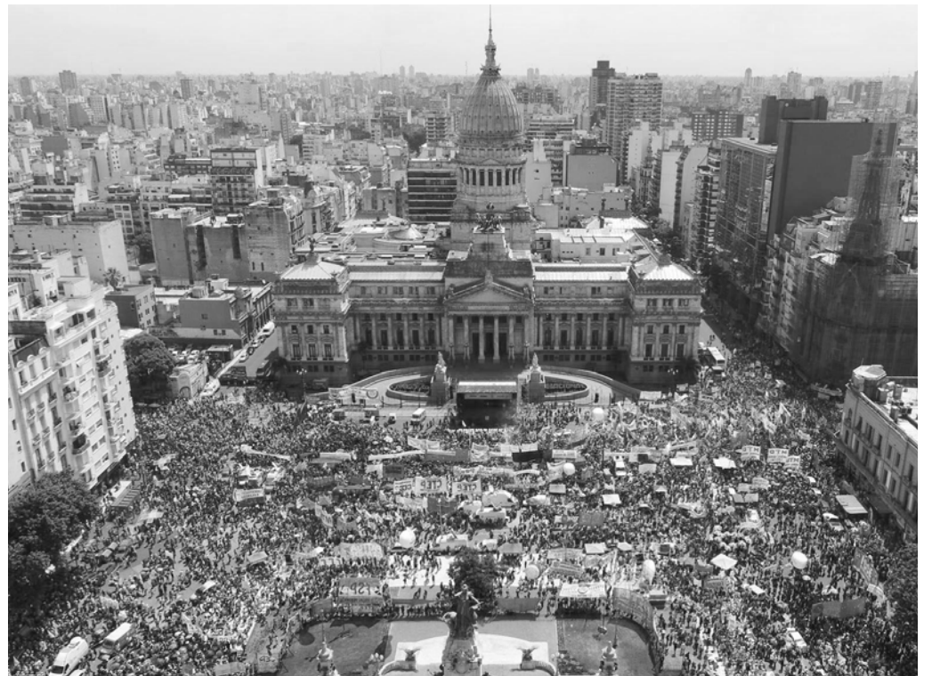
Movilización contra el ajuste del 29 de noviembre en el Congreso

No es el triunfo electoral lo que le da fuerza al gobierno, sino la traición de la dirigencia sindical peronista. Este es el