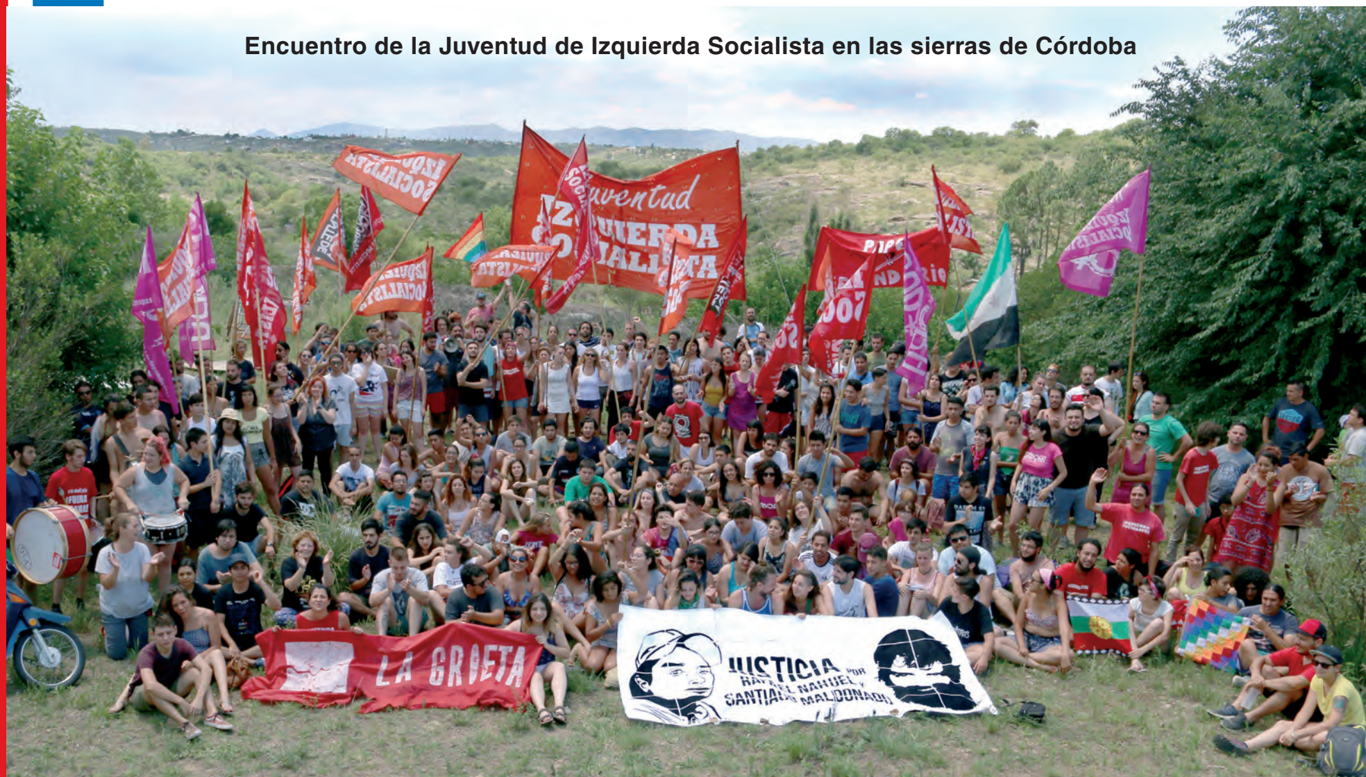
Encuentro de la Juventud de Izquierda Socialista en las sierras de Córdoba

Valoramos la colaboración de cada compañero, militante o simpatizante, como aporte consciente a la construcción y fortalecimiento de nuestro partido. Los invitamos a acercarse a nuestros locales y participar de nuestras reuniones y actividades para que en 2018 hagamos más grande Izquierda Socialista y el Frente de Izquierda.