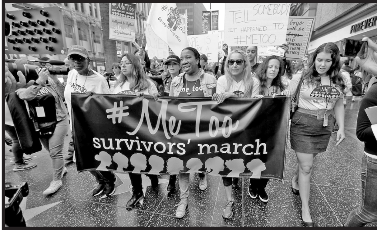
Marcha del movimiento #MeToo en Estados Unidos

El 21 de enero de 2017 fueron miles de mujeres las que salieron a las calles de Washington y de cientos de ciudades en el mundo en repudio de la asunción del presidente norteamericano Donald Trump por capitalista, misógino y racista. Y no fue una casualidad. Desde el #NiUnaMenos de Argentina de 2015, el movimiento de mujeres del mundo viene cobrando fuerzas para rechazar la violencia patriarcal que se expresa no solo con golpes en el ámbito de la pareja, sino que se reproduce en el conjunto de las instituciones sociales y es un pilar fundamental de la explotación capitalista. Por ello, el primer Paro Internacional de Mujeres fue acompañado por un progresivo llamamiento de reconocidas feministas norteamericanas para desarrollar un “feminismo del 99 por ciento”, es decir, de todas las mujeres no explotadoras, que impactó en amplios sectores. Entre ellos, un conjunto de actrices de Hollywood hicieron pública una valiente campaña que