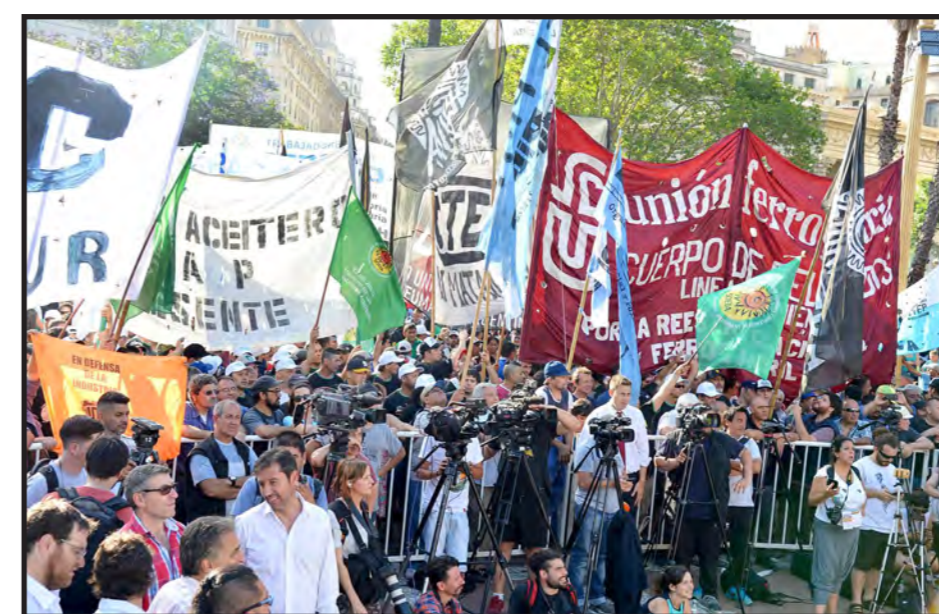
El sindicalismo combativo se movilizó el 29 de noviembre a Congreso y el 6 de diciembre a Plaza de Mayo

crucial paritaria de los docentes en la provincia de Buenos Aires. Y está la amenaza de despidos de trabajadores estatales.