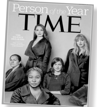
Portada de la revista Time donde las mujeres que denunciaron abusos aparecen como “Personalidad del año”

Ante la magnitud de casos denunciados muchos se preguntan si los violadores y/o abusadores son personas enfermas o, incluso, si las mujeres mienten. Lamentablemente debemos señalar que los casos que comenzaron a conocerse públicamente son apenas la punta del iceberg de la cultura de la violación en la que vi-