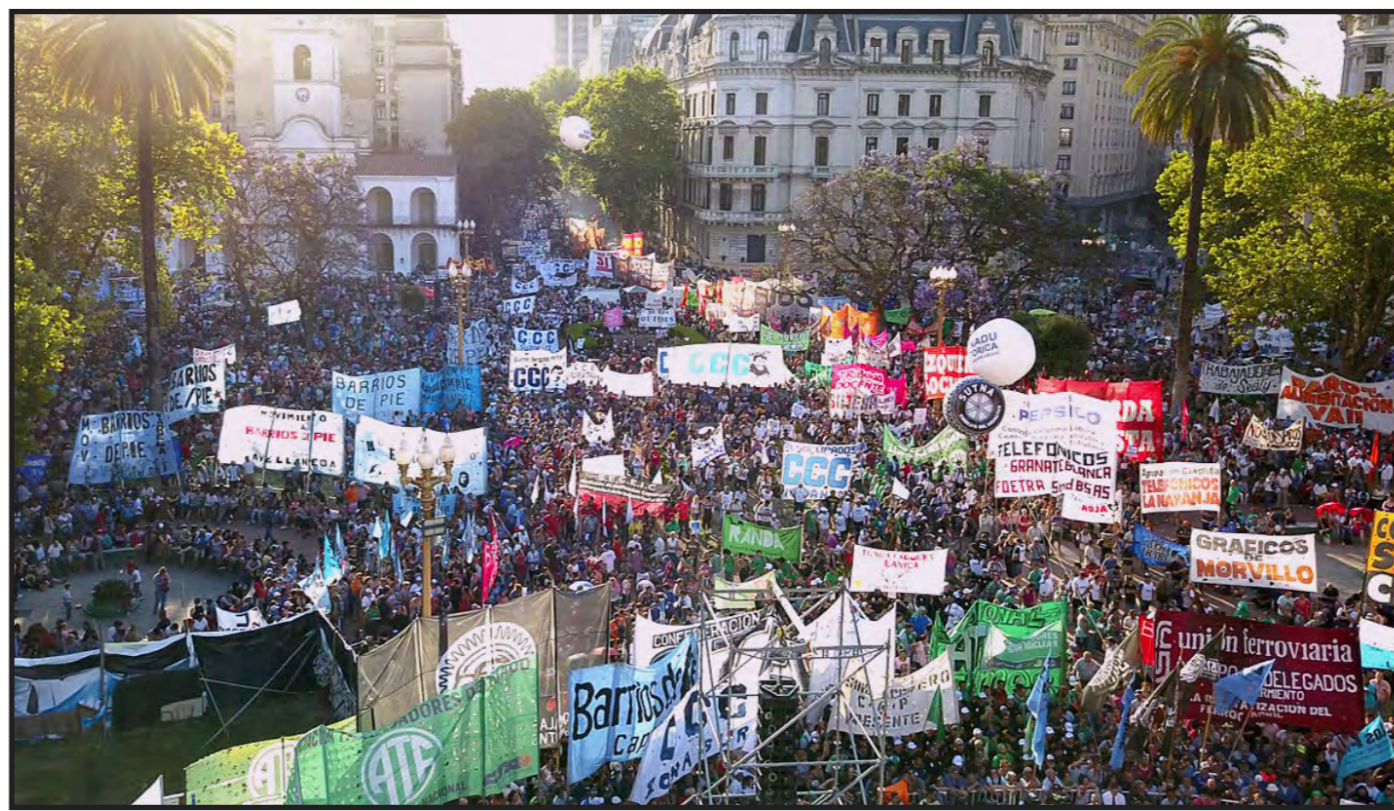
Marcha a Plaza de Mayo el 6 de diciembre contra las "reformas" de Macri

Está planteada la continuidad de la pelea hacia 2018. Contra el propio proyecto de reforma laboral, que el gobierno tarde o temprano tratará de hacer votar. Y todo unido a la pelea que ya se viene, donde otra vez intentarán firmarse acuerdos salariales a la baja. En pocas semanas más comenzará la negociación de la