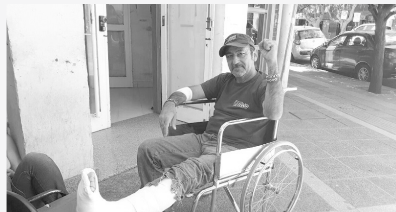
El diputado provincial, Raúl Godoy (PTS-FIT) víctima de la brutal represión

El intento de achique originó el conflicto, los despidos y la respuesta de los obreros que tomaron la planta para resguardarla del vaciamiento y cuidar su fuente de trabajo. Durante estos meses hicieron todo tipo de actividades públicas, colectas y marchas para sostenerse sin cobrar los sueldos. A espaldas de los trabajadores que la ocupan, la burocracia del sindicato maderero pactó con el gobierno la