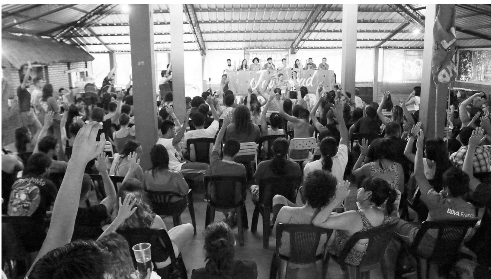
Luego de los debates en las comisiones, se votaron las resoluciones en el plenario final del ENJIS

El ENJIS parte de estas premisas para desarrollarse como un evento abierto a militantes del partido y también independientes,