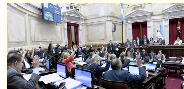
El macrismo logró que se vote el robo a los jubilados con la complicidad de la bancada de senadores peronistas

El kirchnerismo, por su parte, con Cristina a la cabeza recién